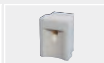
124.583 Сварочная насадка для нахлёста 30 мм