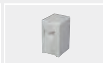
124.431 Сварочная насадка на V-шов V12-X25 (фторопласт)