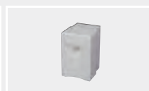
124.582 Сварочная насадка для нахлёста 25 мм