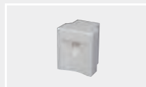
124.585 Сварочная насадка для нахлёста 35 мм