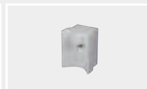
124.610 Сварочная насадка для внешнего угла 15 мм