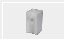
124.430 Сварочная насадка на V-шов V8/10-X15/20 (фторопласт)