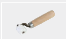
131.693 Прикаточный ролик, 30 мм, фторопласт