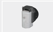
126.116 Сварочная насадка на шов К8/10 в сборе