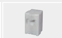
124.432 Сварочная насадка на V-шов V15-X30 (фторопласт)