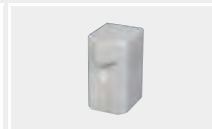
126.106 Сварочная насадка на шов К15 (фторопласт)