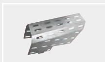
126.098 Защитный кожух для booster EX2