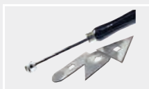
119.178 Шабер с насадками, комплект