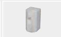
126.105 Сварочная насадка на шов К8/10 (фторопласт)