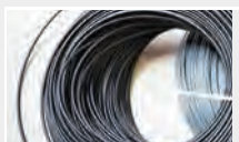
Пруток ПП, ПЭ в ассортименте по запросу