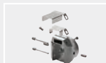
126.102 Сварочная насадка (металлическая основа)