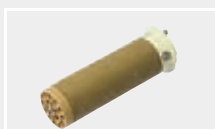
116.900 Нагревательный элемент с защитной трубкой