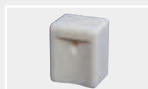
126.103 Сварочная насадка для нахлёста ТРО/ФРО 30/1,5