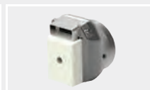
126.100 Сварочная насадка заготовка в сборе