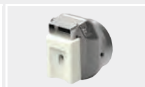
126.101 Сварочная насадка для нахлёста 30/1,5