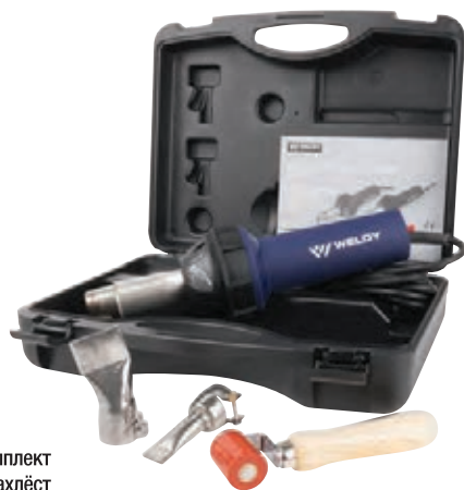
Комплект для сварки внахлест